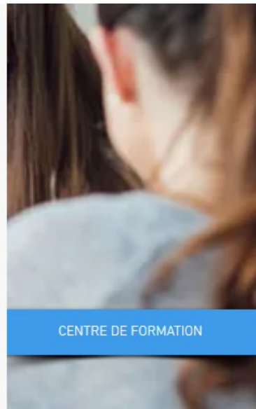
CENTRE DE FORMATION